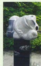
「カン蛙」の彫刻 （杉並木公園）

※ 6月3日セミナー終了後、徒歩での 宇都宮ナイトクルーズ（無料）。希望者は当日申込み。